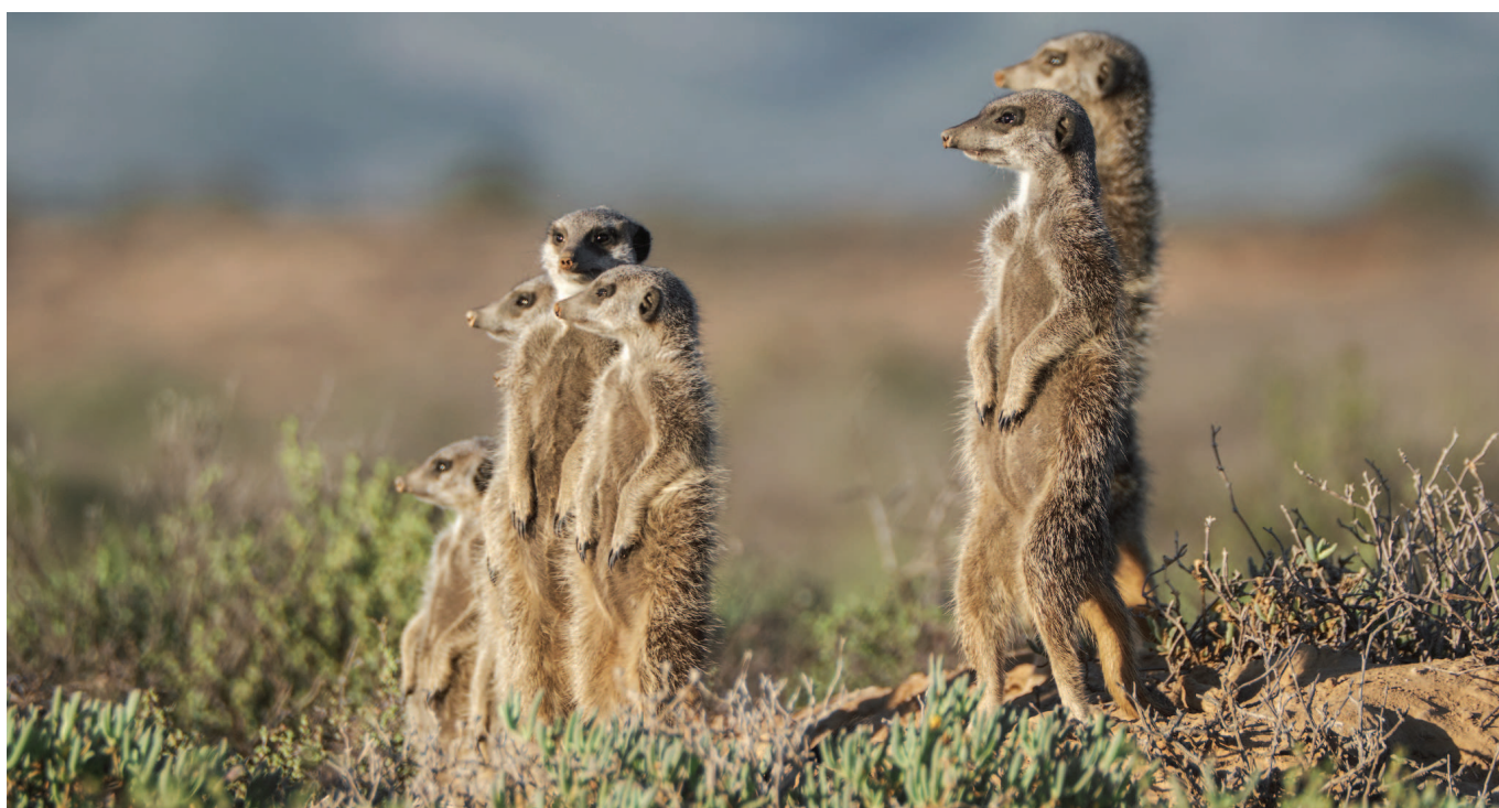
Erdmännchen-Tour in Oudtshoorn