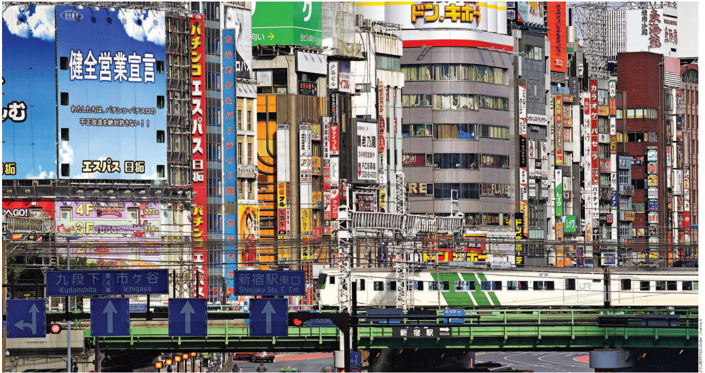
Shinjuku-Viertel in Tokyo