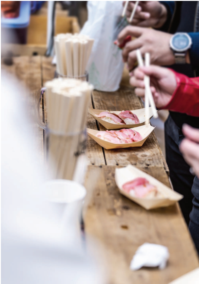
Das frischeste Sushi der Welt auf dem Tsukiji-Fischmarkt